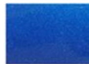
Azul cobalto metálico (G8P)