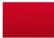
Rojo sólido (GG2)