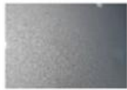
Plata brillante (GAN)