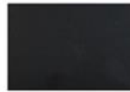
Negro carbón metálico (GB0)